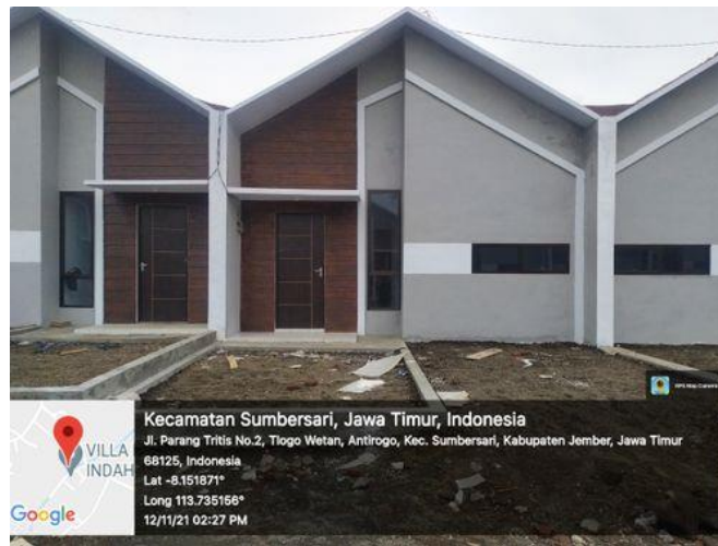
Gambar 1.5. Eksplorasi fasad pada Arsitektur Kontemporer Villa Bougenville Jember