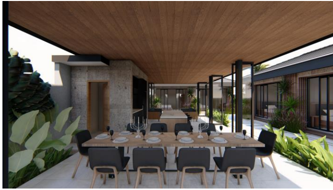
Gambar 1.6.. Eksplorasi Interior pada Arsitektur Kontemporer Villa Bougenville Jember