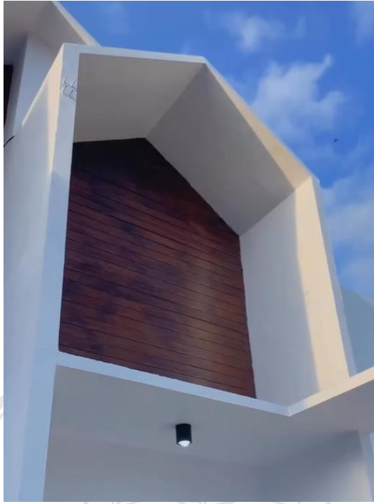
Gambar 4.11. Villa Bougenville Indah Jember.

Modernisme juga mempengaruhi tata ruang dengan memperkenalkan konsep open plan atau tata ruang terbuka. Ini memungkinkan ruang-ruang dalam bangunan menjadi lebih fleksibel dan terhubung, menciptakan aliran yang lebih baik antara ruang dalam dan luar serta memaksimalkan pencahayaan alami. Konsep ini bertujuan untuk menciptakan ruang yang lebih efisien dan nyaman, berbeda dari desain sebelumnya yang lebih terkotak-kotak dan tersegmentasi