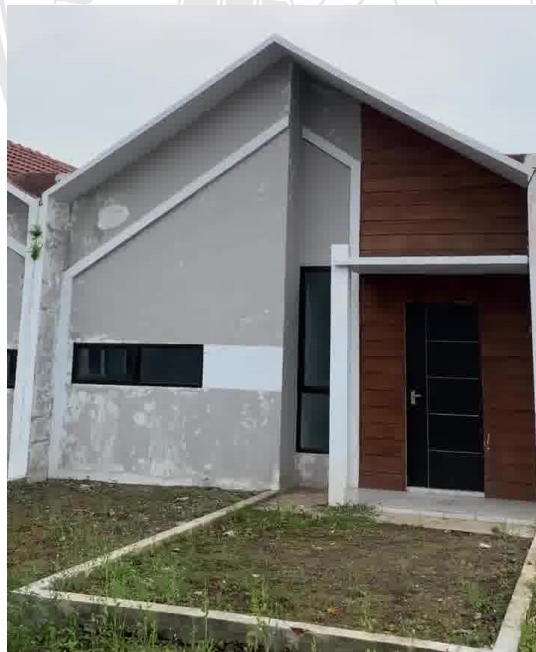
Gambar 4.10. Objek Gambar Secara Umum Villa Bougenville Indah Jember.