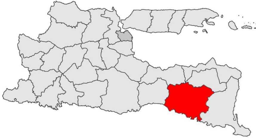
Gambar 1.1. Peta Provinsi Jawa Timur