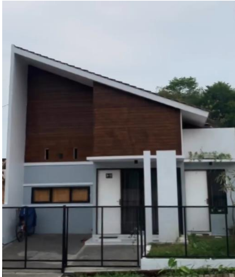
Gambar 4.13. Villa Bougenville Indah Jember.