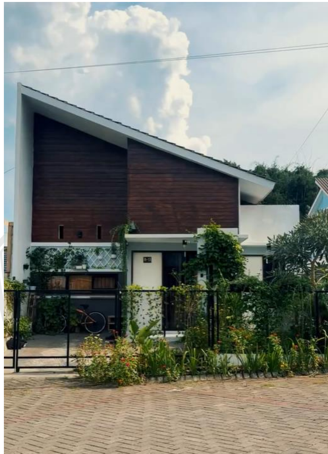
Gambar 4.12. Vegetasi Villa Bougenville Indah Jember.

Dengan pendekatan ini, Villa Bougenville Indah tidak hanya mencerminkan keindahan modern dalam desain arsitektur tetapi juga mengakomodasi kebutuhan fungsional dan konteks lokal, menciptakan sebuah contoh arsitektur yang harmonis dan inovatif.