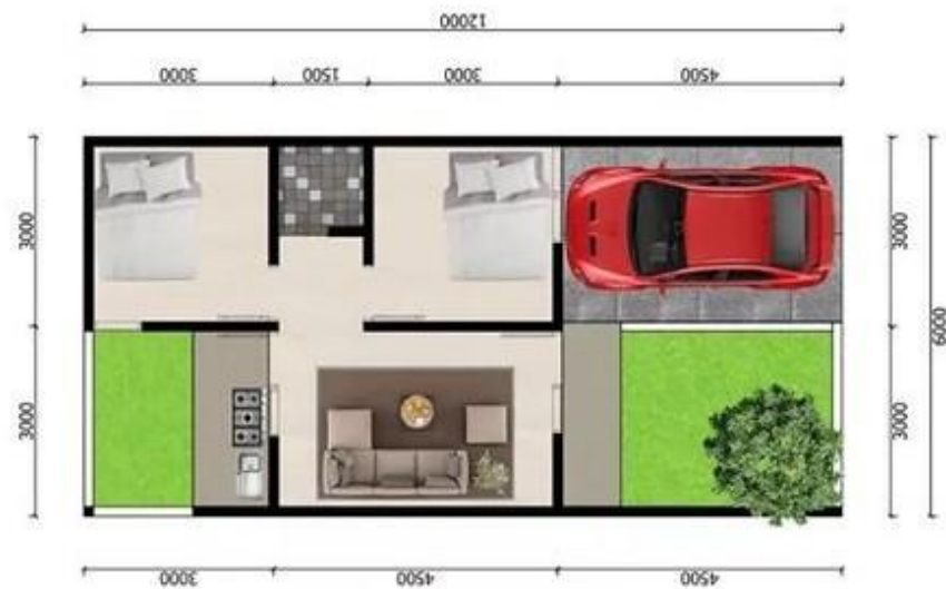
Gambar 1.7. Eksplorasi Denah pada Arsitektur Kontemporer Villa Bougenville Jembe tipe 40

Villa tipe 40 adalah hunian dengan luas sekitar 40 meter persegi yang ideal untuk pasangan atau keluarga kecil. Meskipun kecil, desainnya mengutamakan efisiensi ruang dengan satu hingga dua kamar tidur, ruang tamu, dapur kecil, dan kamar mandi, seringkali dengan konsep terbuka dan penggunaan material yang memaksimalkan pencahayaan alami. Villa ini biasanya terletak di daerah wisata atau pinggiran kota, cocok untuk rumah liburan atau tempat tinggal sementara. Keunggulannya termasuk biaya konstruksi rendah dan perawatan mudah, meski ruangnya terbatas dan memerlukan desain interior yang cermat untuk memaksimalkan fungsi.