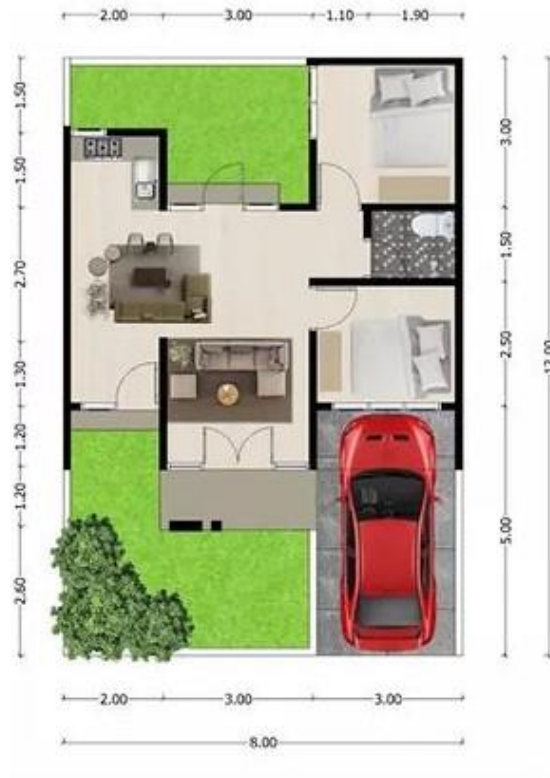
gambar 1.8. Eksplorasi Denah pada Arsitektur Kontemporer Villa Bougenville Jember tipe 54

Rumah tipe 54 memiliki luas bangunan sekitar 54 meter persegi, ideal untuk keluarga kecil dengan dua hingga tiga kamar tidur, ruang tamu, dapur, dan satu atau dua kamar mandi. Desainnya sering memadukan konsep ruang terbuka untuk meningkatkan kenyamanan, dengan penggunaan material yang fungsional dan estetis. Rumah tipe ini biasanya dirancang untuk menyediakan ruang yang lebih lapang dibanding tipe yang lebih kecil, menawarkan kenyamanan dan fleksibilitas lebih bagi penghuninya. Terletak di kawasan perumahan, rumah tipe 54 populer karena seimbang antara luas, kenyamanan, dan efisiensi.