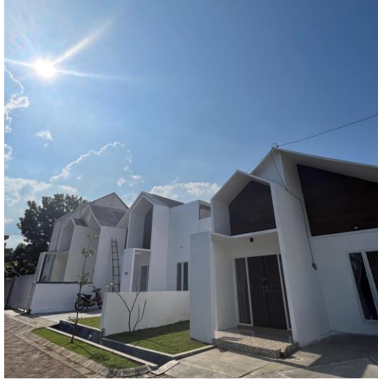
Gambar 4.9. Objek Gambar Secara Umum Villa Bougenville Indah Jember.

. Berikut adalah gambar secara umum Villa Bougenville Indah di Jember: