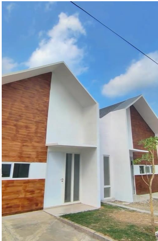
Gambar 4.14. Fasad Villa Bougenville Indah Jember.