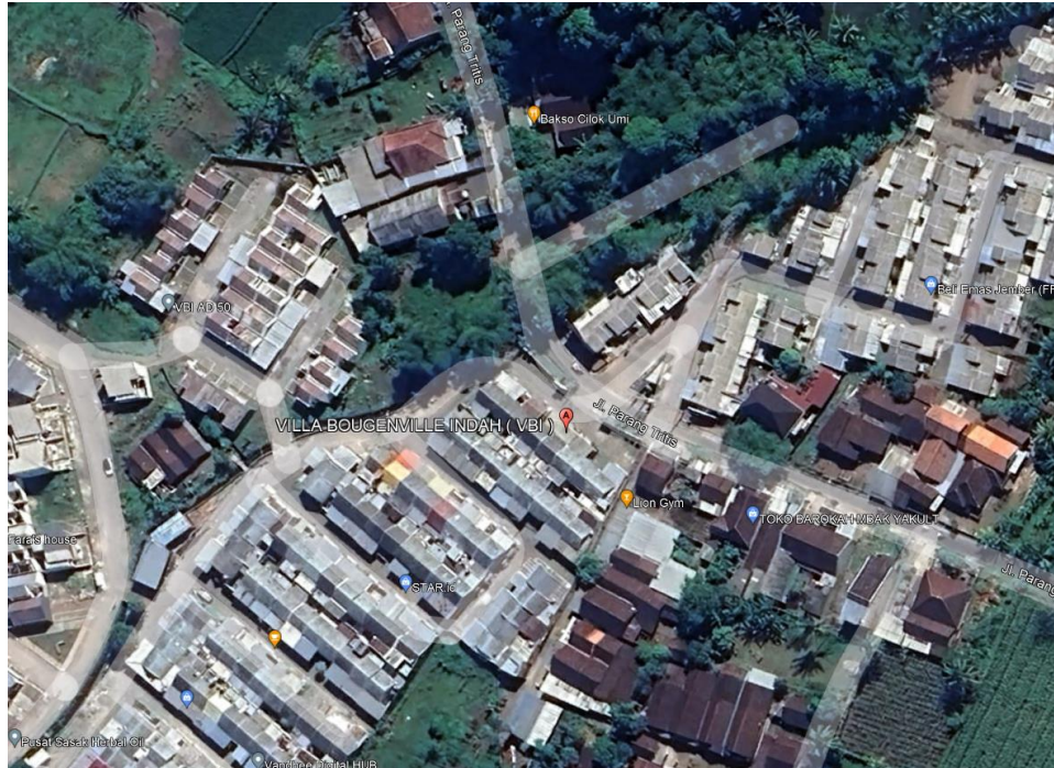
Gambar 1.3. Lokasi Tapak

Villa Bougenville Indah mencerminkan berbagai karakteristik estetika modernisme, seperti kesederhanaan bentuk, penggunaan material modern seperti beton, kaca, dan baja, serta tata ruang yang terbuka dan fungsional. Modernisme dalam arsitektur menekankan pada bentuk yang sederhana dan bersih, fungsionalitas, dan penggunaan teknologi serta material baru yang inovatif[1]. Prinsip-prinsip ini sangat terlihat dalam desain Villa Bougenville Indah.