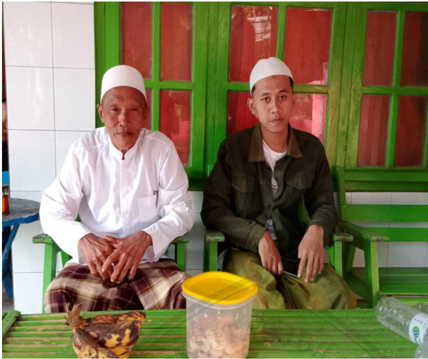
Interview Bersama Tokoh Masyarakat