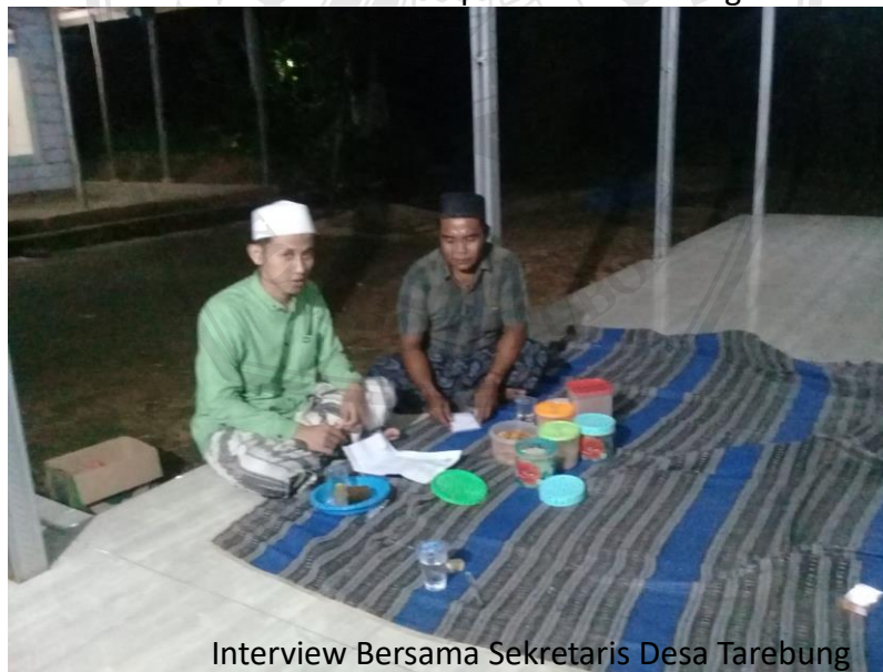
Interview Bersama Sekretaris Desa Tarebung