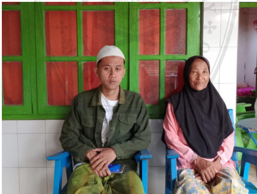
Nyi Bullah Sebagai Objek dari Pembagian Harta Waris