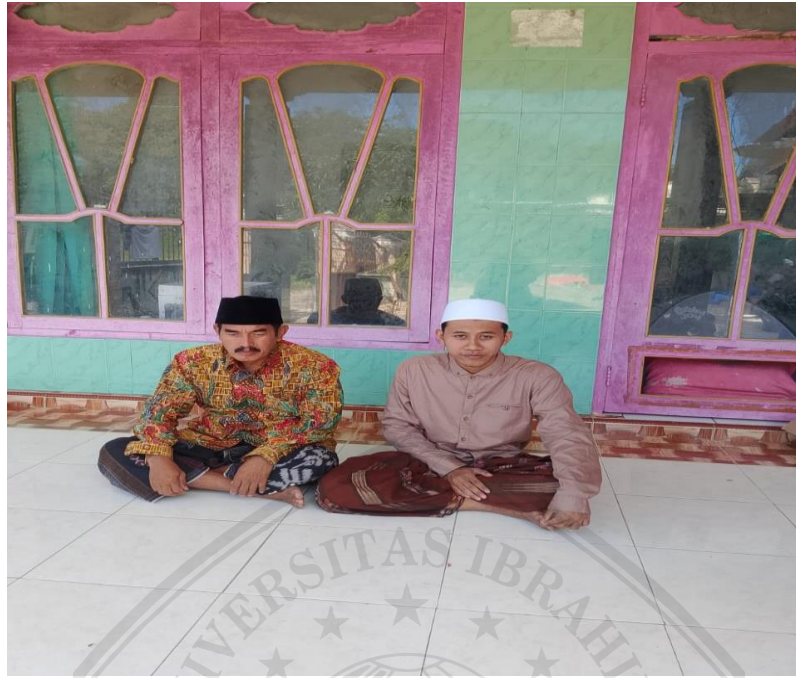
Interview Bersama Kepala Desa Tarebung